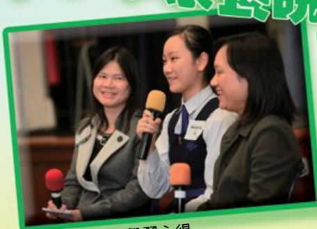
在學同學分享學習心得