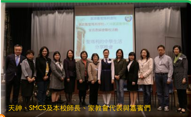
天神、SMCS及本校師長、家教會代表與嘉賓們