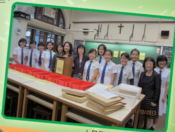
十月三十一日點票前合照