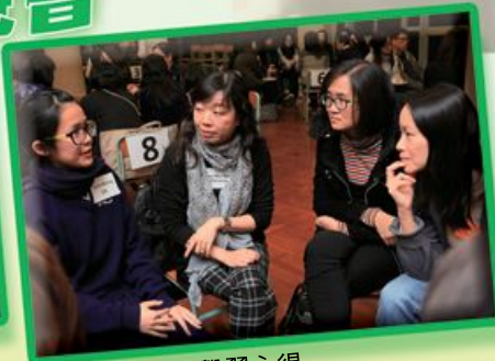
在學同學分享學習心得