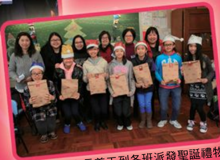
家長義工到各班派發聖誕禮物