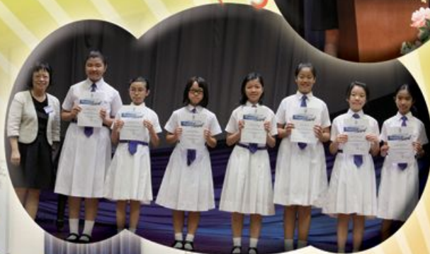
最佳進步獎得獎學生