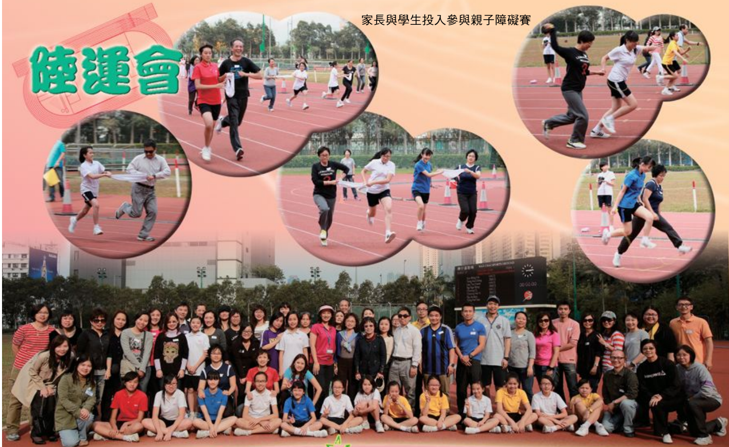
全校師生及家長共同參與聯歡活動