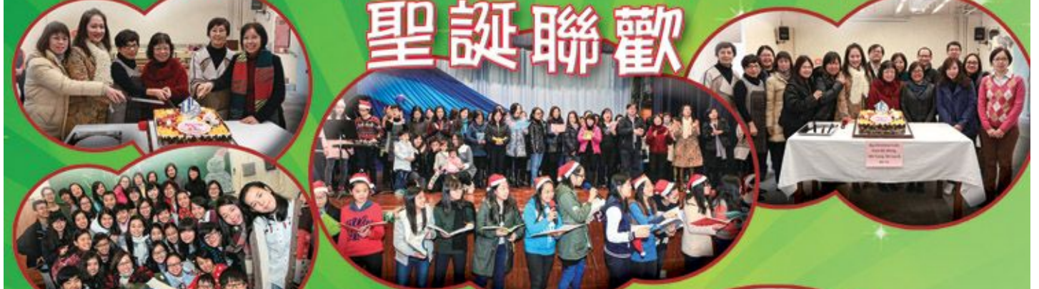
全校師生及家長共同參與聯歡活動