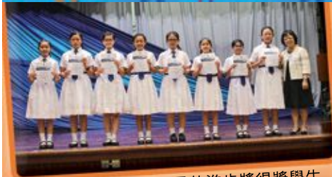
最佳進步獎得獎學生