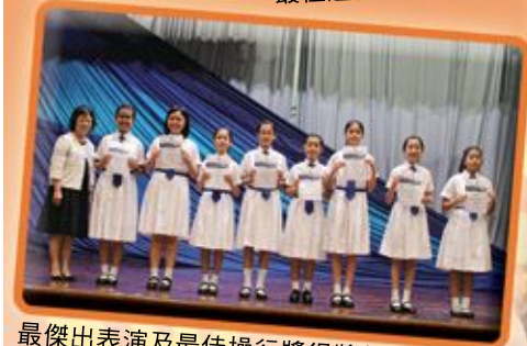
最傑出表演及最佳操行獎得獎學生