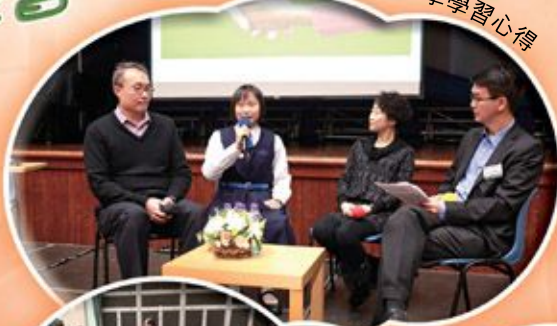
在學同學分享學習心得

天神、SMCS及本校家教會合辦中小學家長晚會，安排畢業同學、中學同學及中學家長與小四/小五家長分享中學生活，當晚約300人出席。