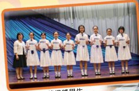
最積極參與獎得獎學生