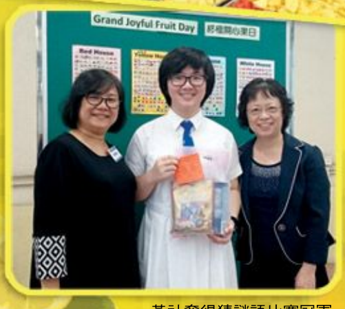
黃社奪得猜謎語比賽冠軍