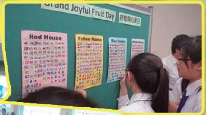
四社積極參與猜謎語比賽