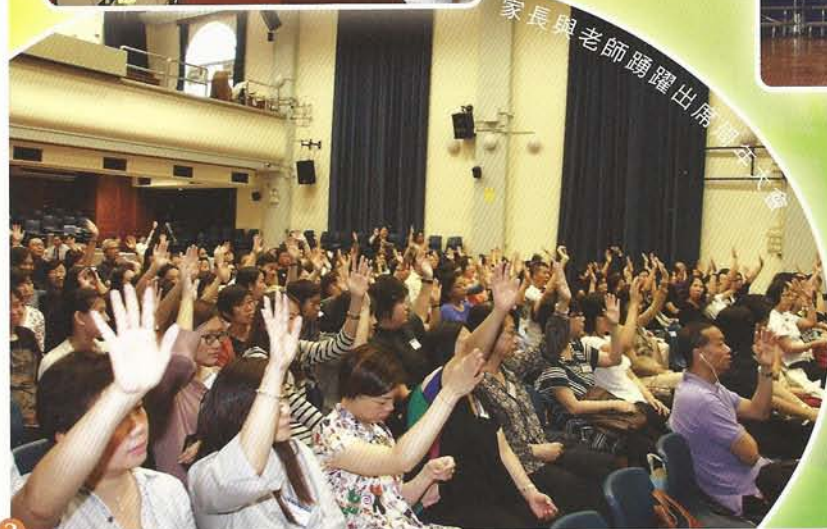
家長與老師踴躍出席