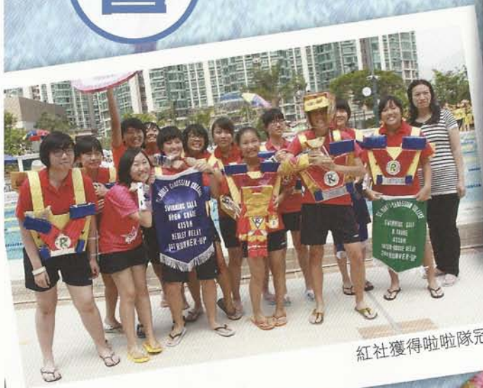
紅社獲得啦啦隊冠軍