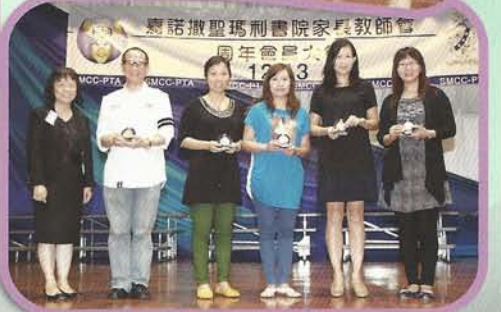
榮獲銅獎的家長義工