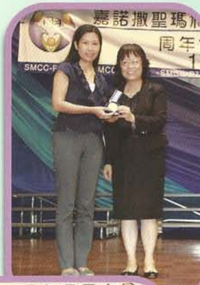
榮獲金獎 的家長義工