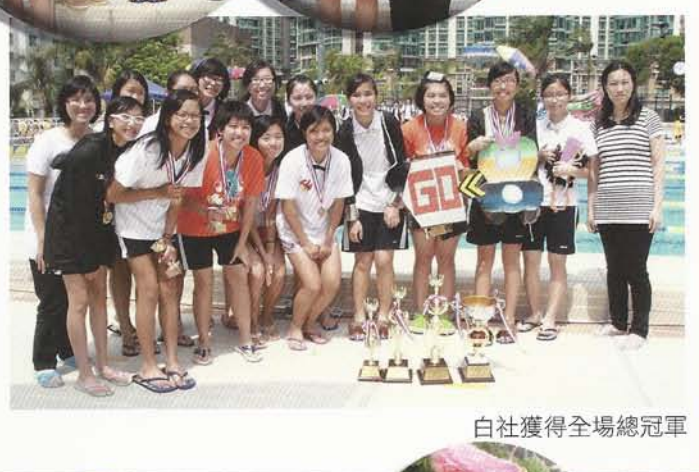
白社獲得全場總冠軍