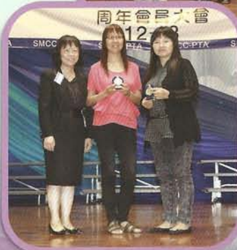
榮獲銀獎的家長義工