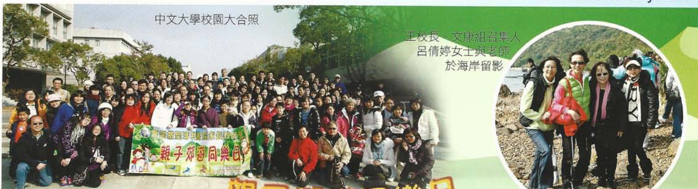
中文大學校園大合照