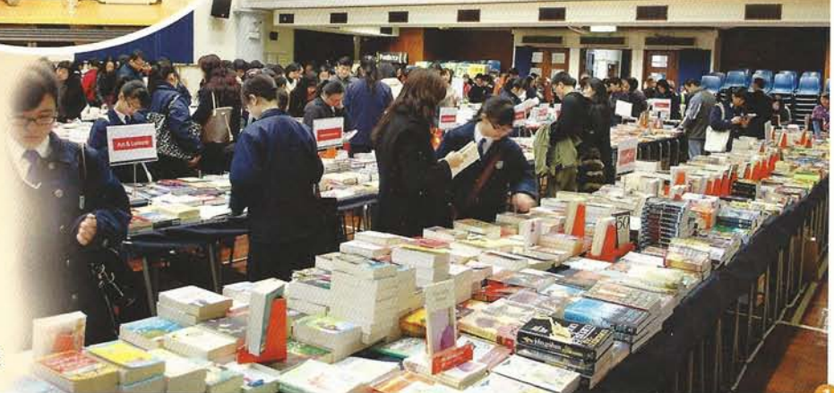
家長與學生齊逛書展