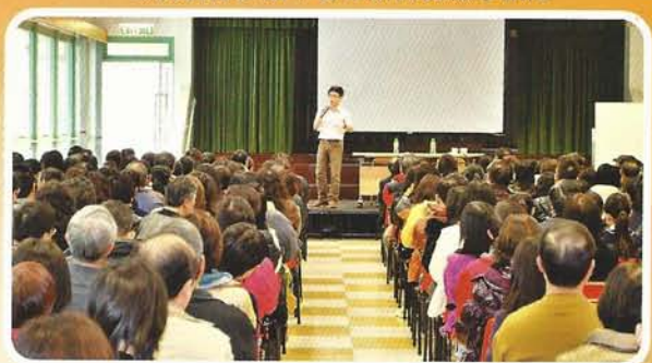
家長踴躍參加本會舉辦的記憶學講座