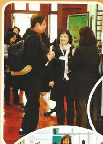
王校長與 家長親切交談