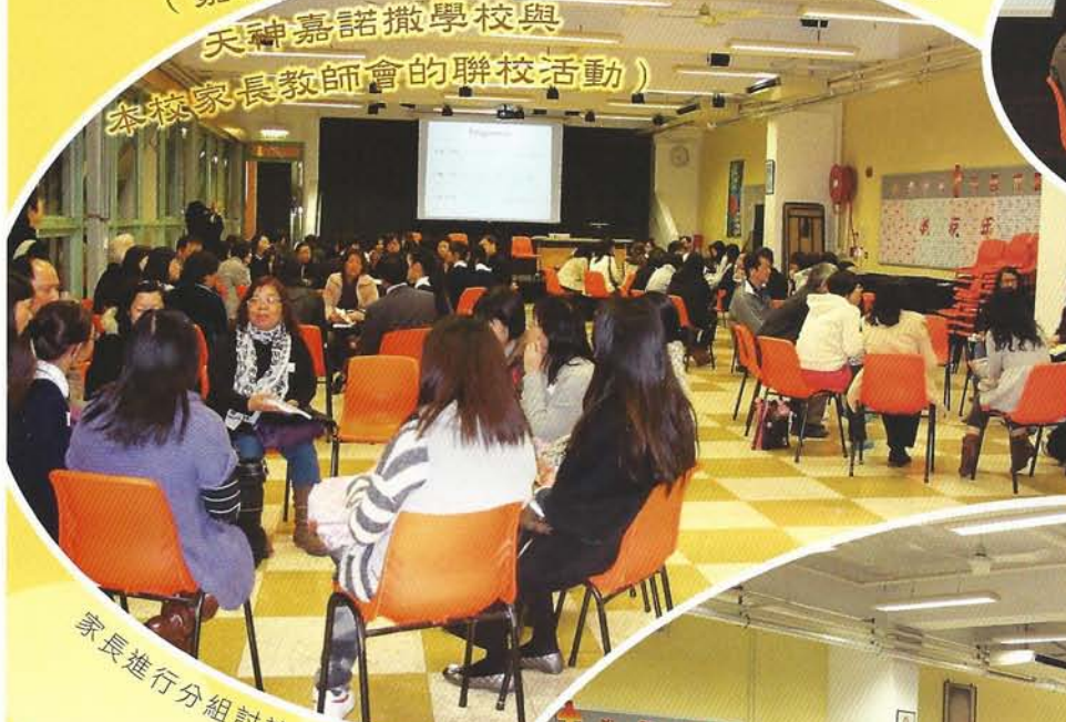
家長進行分組討論