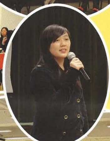
分享晚會獲得眾多 小學家長支持