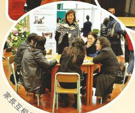
家長互相分享親子經驗