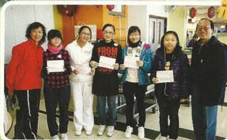
孫主席與 大抽獎的 幸運兒合照